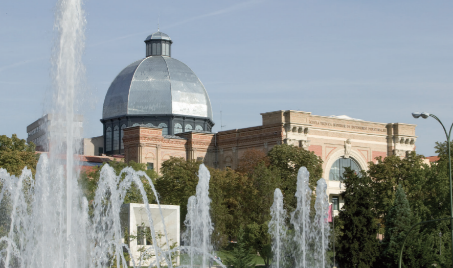
Palacio de la Industria y las Artes en el Paseo de la Castellana

UNIVERSIDAD POLITÉCNICA DE MADRID www.upm.es Vicerrectorado de Alumnos y Extensión Universitaria Rectorado, Edificio B. Pº Juan XXIII, 11. 28040. Tl: 91 067 00 07